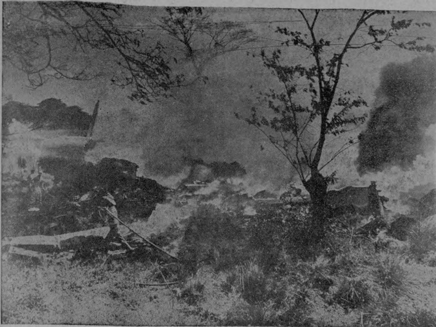
Campo de llamas, tras serlo de dolor. Campo que arde en torno a los restos humeantes del avión. Campo que riegan las aguas que saltan de los pitones de los bomberos. Catorce cuerpos quemados y mutilados quedaron sobre la tierra mojada por el agua de los extinguidores, en la tragedia del 6 de marzo en las vecindades de la Escuela de Agricultura de Nicaragua.