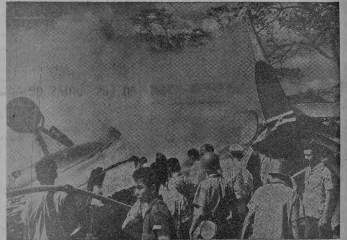
Bomberos y Guardias Nacionales acuden al sitio de la tragedia, tratando inútilmente de salvar algo de la catástrofe. Dos partes del avión que se salieron del radio de acción de los tanques de gasolina. Fueron esas las únicas partes que no consumió el fuego

El Capitán Mateo González Ordenada se graduó en México en Ingeniería de Aviones. El es el Contralor de tránsito Aéreo de Nicaragua y fue el funcionario que hizo el último contacto con el Viscount en vuelo. Su opinión es valiosa. Dice que “todo estaba bien. El viento calmó y el cielo despejado. El aparato despegó de la pista a